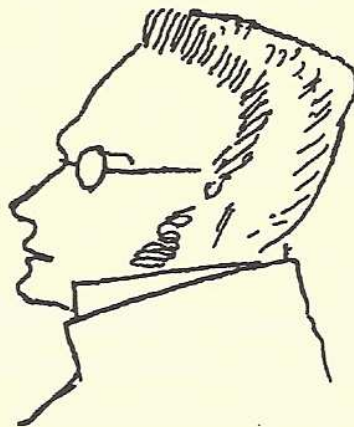
Max Stirner (σχίτσο του Φρήντριχ Ένγκελς)